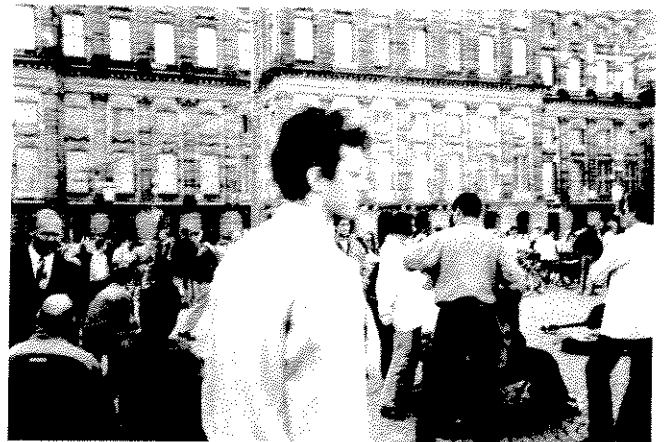
Foto: Menschen einer Großstadt – Krisenverdrängung durch Zivilisationsneurose?

Ermöglicht wird die Abspaltung von Empfindungen durch den Verdrängungsmechanismus. Er sorgt dafür, daß ins Unbewußte verdrängt wird, was dem Bewußtsein des Betroffenen unerträglich (schmerzhaft) ist. Wie "gut" dieser Verdrängungsmechanismus beim Individuum funktioniert, liegt wesentlich auch daran, wie früh und wie oft er ausgelöst wurde.